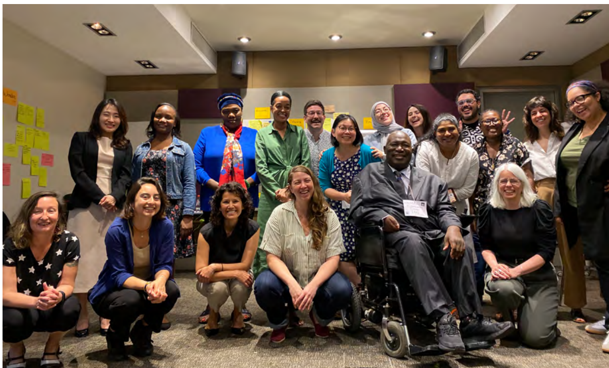
Participantes del taller de coproducción del conocimiento (por favor, revise la página 16 con una lista de nombres y afiliaciones).

muchas preguntas sobre cómo aplicar la interseccionalidad en las políticas y acciones de adaptación; sin embargo, al final contamos con una pequeña comunidad que sintió que había creado algo en conjunto.