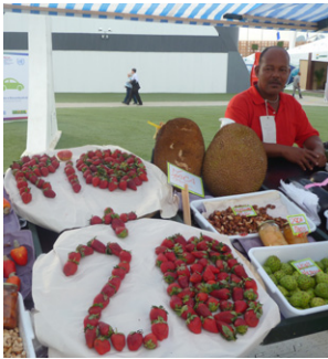
Продавец местных продуктов сельского хозяйства поддерживает проведение саммита «РИО+20», Рио-де-Жанейро, Бразилия. По данным ООН, мелкие фермеры обеспечивают до 80% продовольствия в развивающихся странах.

Ряд участников конференции считает, что в нынешней международной ситуации даже просто подтверждение ранее принятых принципов и договоренностей имеет важное значение. Так, Мартин Хор из «Южного Центра» считает достижением подтверждение принципа общей, но дифференцированной ответственности. Этот принцип содержался в Рио-де-Жанейрской декларации по окружающей среде и развитию 1992 года. Тогда страны договорились о сотрудничестве в духе глобального партнерства для сохранения экосистемы Земли, однако согласились, что вследствие своей различной роли в ухудшении состояния глобальной окружающей среды они несут различную ответственность. Соответственно, развитые страны должны вносить больший вклад – как финансовыми ресурсами, так и технологиями – в общее дело. Однако, как считает Мартин Хор, впоследствии этот принцип стал вымываться из международных отношений и от развивающихся стран также стали требовать непосильных обязательств. В то же время развитые государства недостаточно выполняли решения по оказанию помощи. Подтверждение Принципов Рио в декларации «Рио+20», по мнению Мартина Хора, позволит обернуть вспять негативные тенденции.