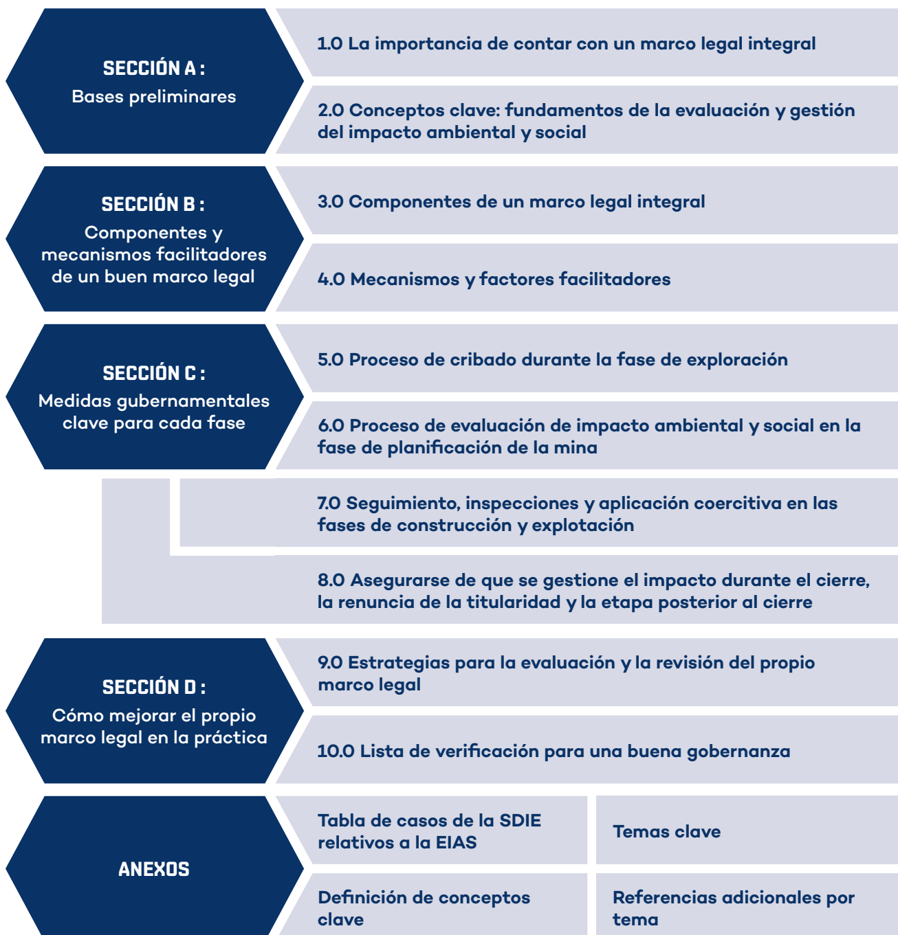
FIGURA 1. ORGANIZACIÓN DE LA GUÍA