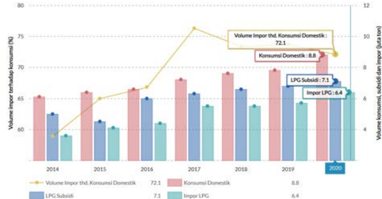
Volume konsumsi domestik, subsidi dan impor LPG, 2014-2020

INDONESIA MENJADI NET IMPORTIR MINYAK BUMI SEJAK 2004 DAN GAP TERUS MELEBAR